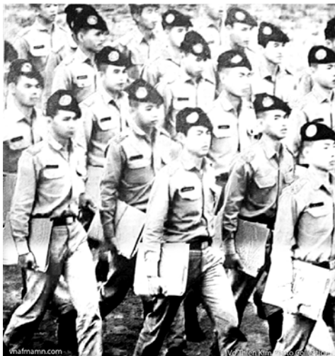
Khoá 25 trên đường tới lớp học

Còn lỗ như quá khứ của một người là thảm họa, đau buồn, thì thái độ sẽ là sự lắng đọng, suy tư và chấp nhận để trở thành hoài niệm. Đằng sau... quay, là một loại biến thể, có thể xem như chiêu thức độc đáo trong binh pháp: “Tam Thập Lục Kế”, thì “Tẩu Vi Thượng Sách”. “Tẩu” là chạy thực mạng, là tránh tai họa, là xa lánh cái xấu. Ở tuổi già, thì “tẩu” với bệnh hoạn, với cái chết là đúng rồi. Con nhà lính, bài cơ bản thao diễn đầu tiên mà SVSQ cán bộ đã dạy: “Đằng sau... quay”, thì cứ mà quay. Đi tới không được thì “quay”, giải quyết chuyện gì cũng không xong, thì “quay”. Trường VBQG đã dạy SVSQ quay, thì cứ mà “quay”, không ai có thể thắc mắc, bắt bẻ được, phải không SVSQ?