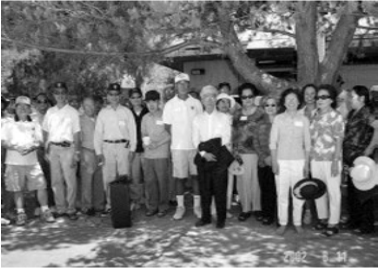
Vui tươi... họp mặt