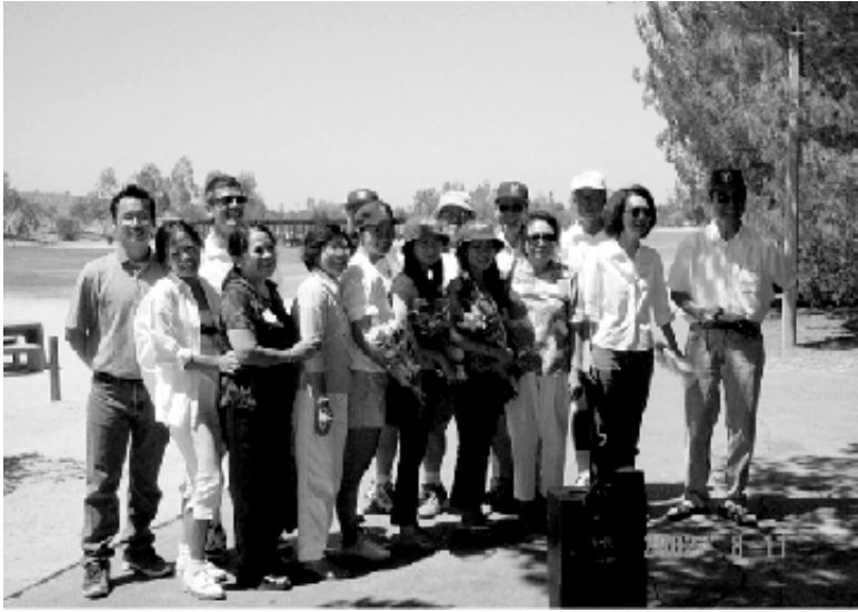
Hai Thế Hệ Một Niềm Tin