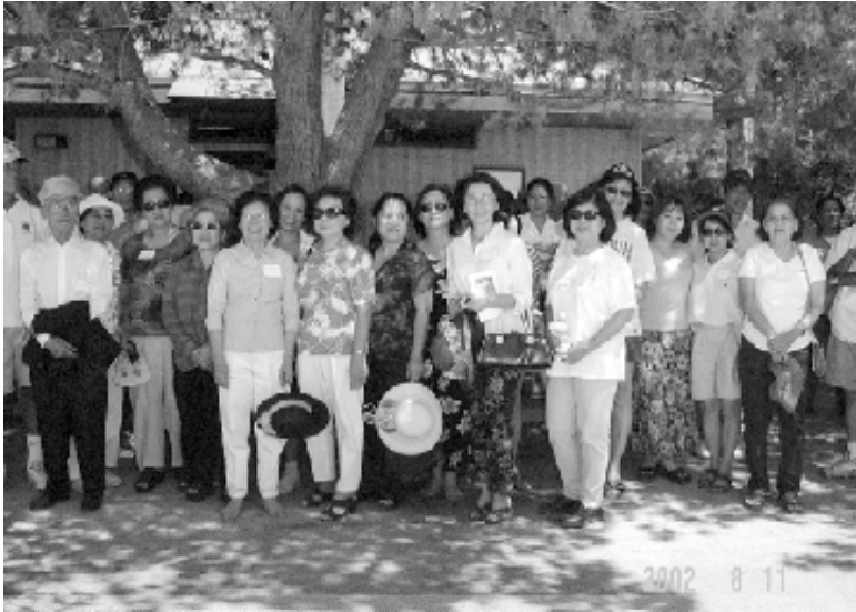
cởi mở tâm tình ....