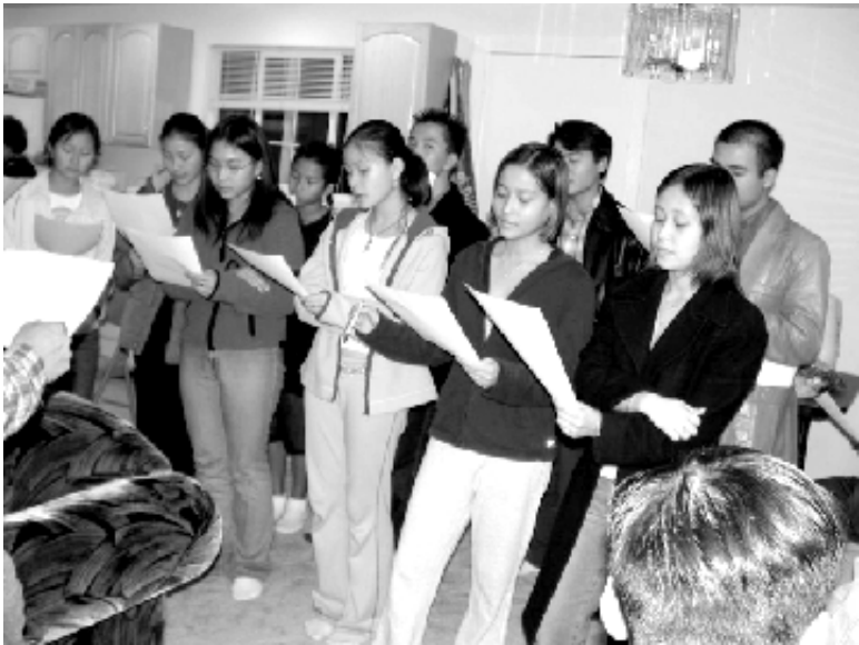
Chuẩn bị văn nghệ cho Xuân Quý Mùi