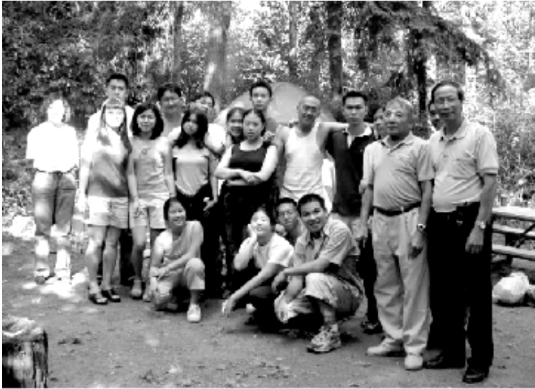
Trại Hè Hạp Mặt