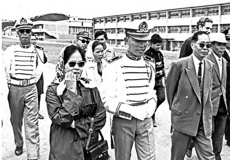
Các tân thiếu úy hướng dẫn gia đình thăm doanh trại SVSQ, sau buổi lễ tốt nghiệp.

Những chuyện trên là những chuyện vụn vặt trong đời mà tôi đã trải qua. Nhưng nó đã chứng minh cho tôi thấy quả thật có tình anh em sâu đậm giữa các CSVSQ cùng tốt nghiệp từ TVBQGVN.